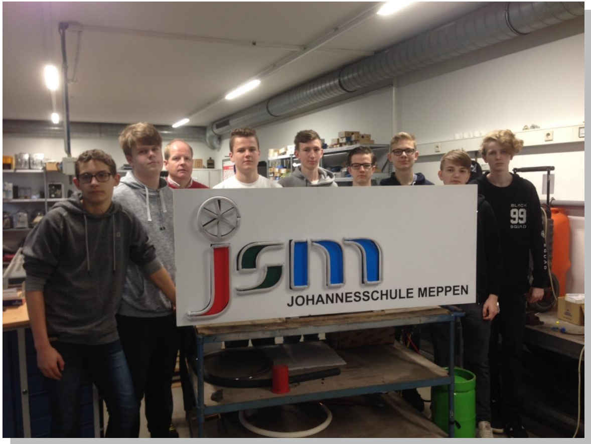
Kooperation WPK Technik mit BBS Meppen -> Werkstücke