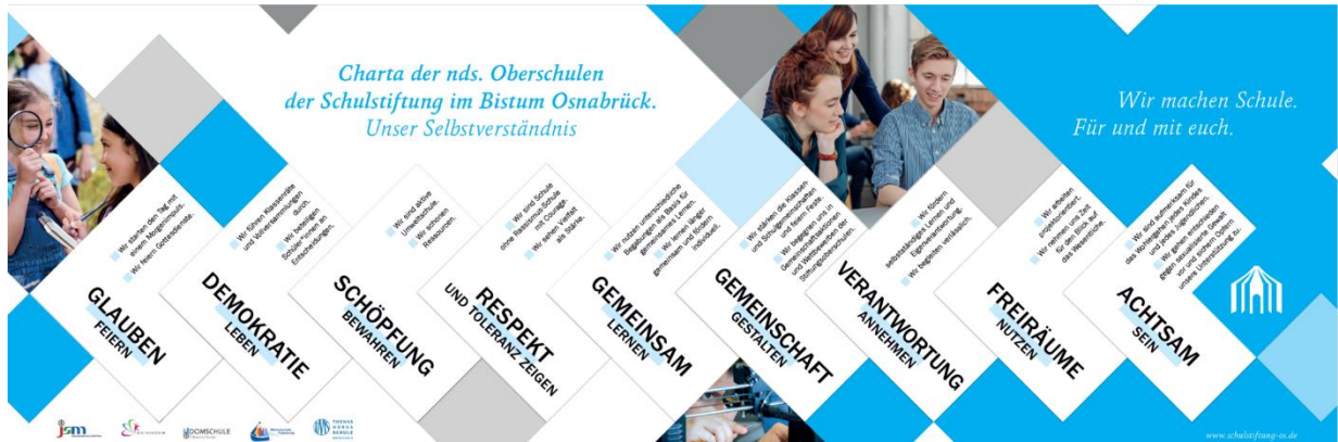
Abbildung 1 - Charta der Oberschulen Schulstiftung Bistum OS

Als katholische Schule orientiert sie ihre Pädagogik am christlichen Menschenbild: Der Mensch als Geschöpf Gottes ist Mitgestalter der Welt und deshalb verantwortlich für das eigene Leben,